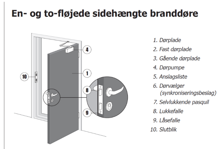
Illustration fra DBI vejledning 26 – Branddøre og brandskydeporte, 1. udgave, juni 1990.

DBI vejledning 26 – Branddøre og brandskydeporte. Branddøre skal udføres med låsekasse med lukkefalle og låsefalle. Se illustrationen herunder.